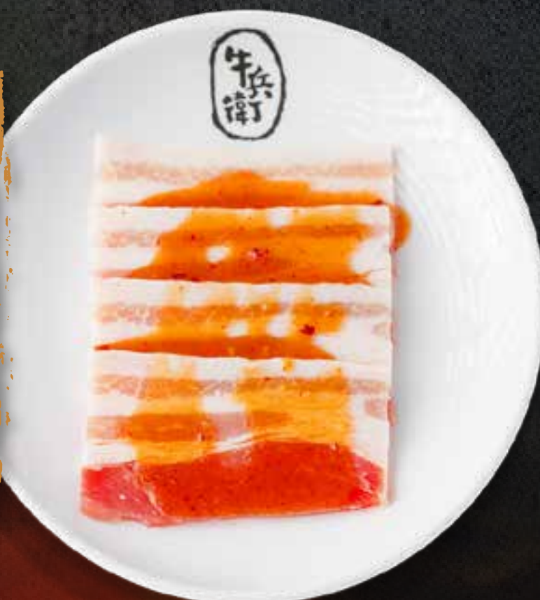
MISO PORK BELLY