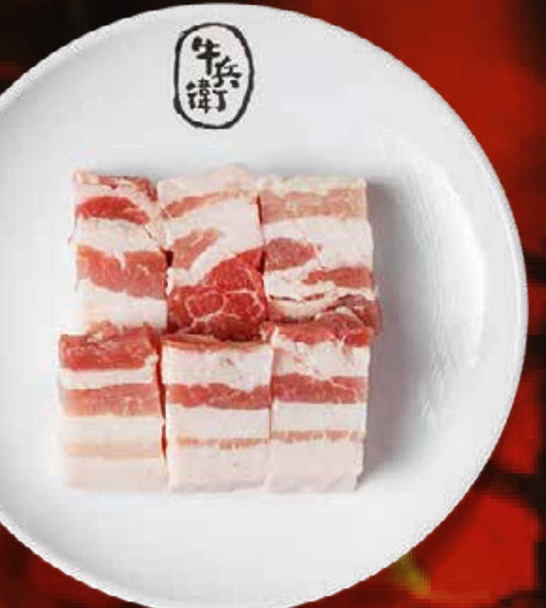
PORK BELLY (THICK CUT)