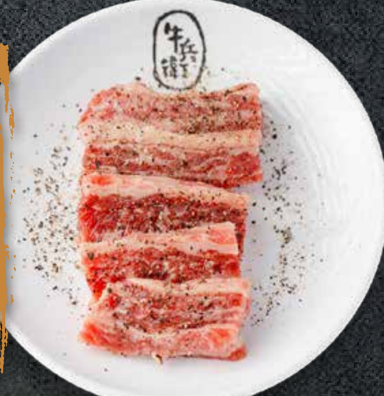
BLACK PEPPER KALBI