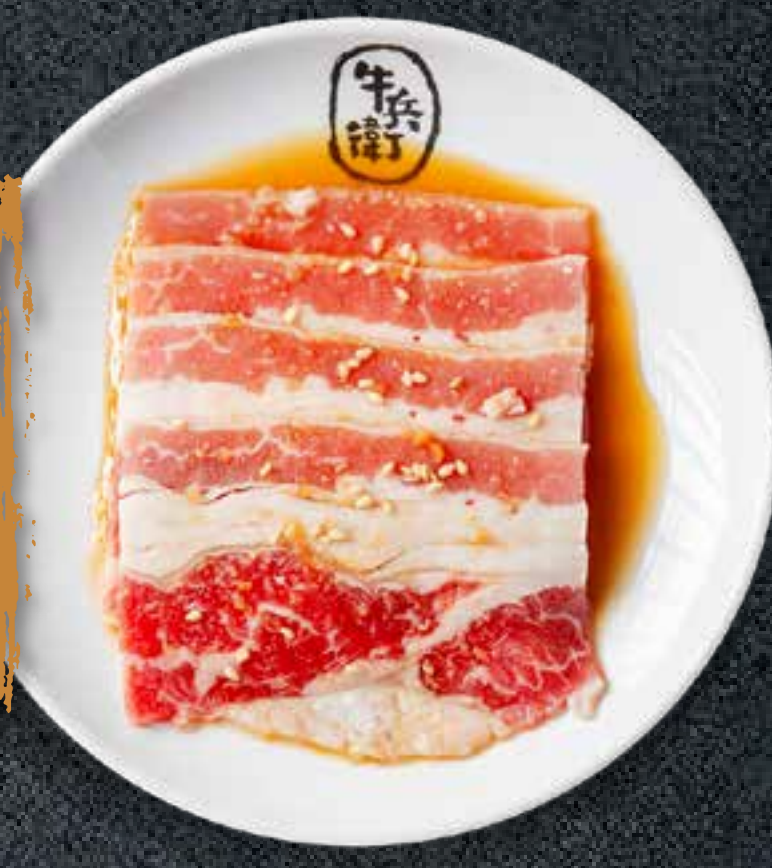
SWEET SOY BEEF BRISKET