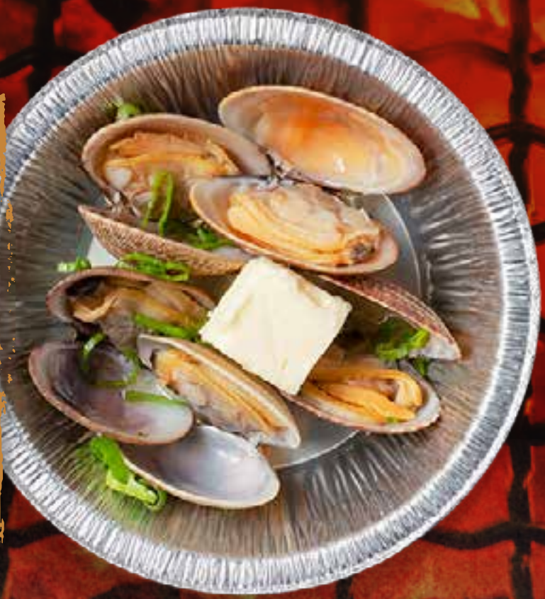
PALOURDE À LA VAPEUR AU SAKÉ