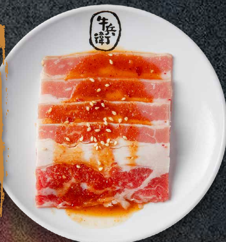
MISO BEEF BRISKET