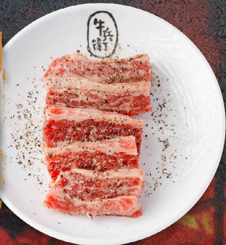
BLACK PEPPER KALBI