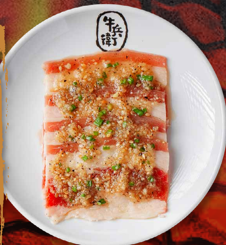
GARLIC BEEF BRISKET