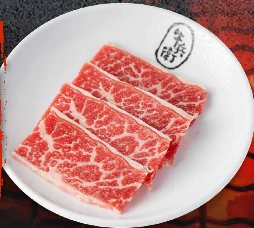
PRIME KALBI .....