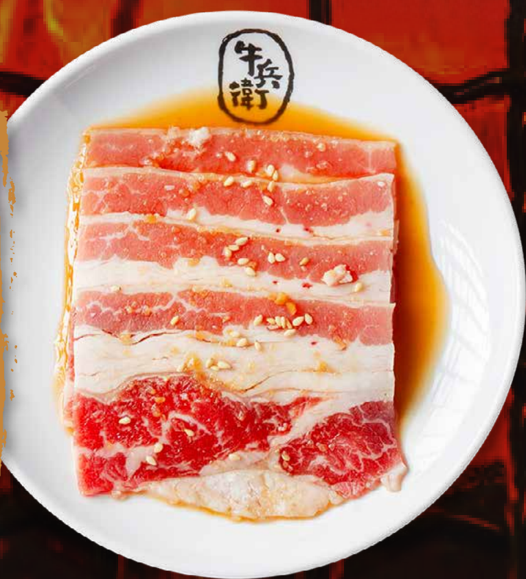
SWEET SOY BEEF BRISKET