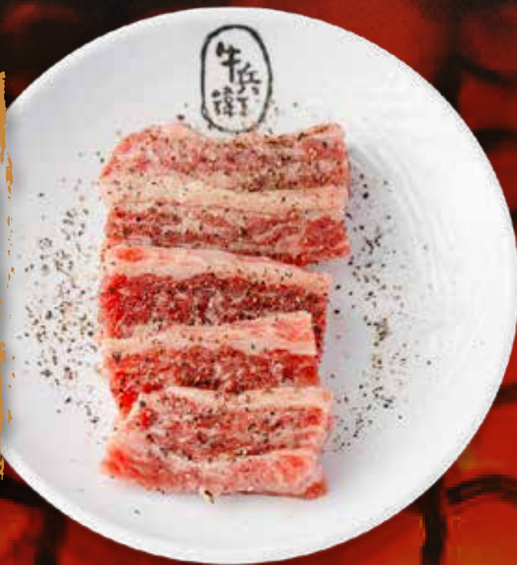
BLACK PEPPER KALBI