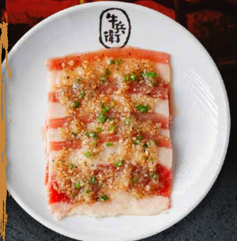
GARLIC BEEF BRISKET