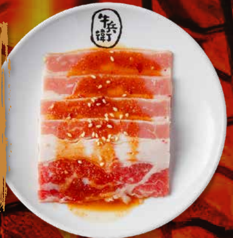
MISO BEEF BRISKET