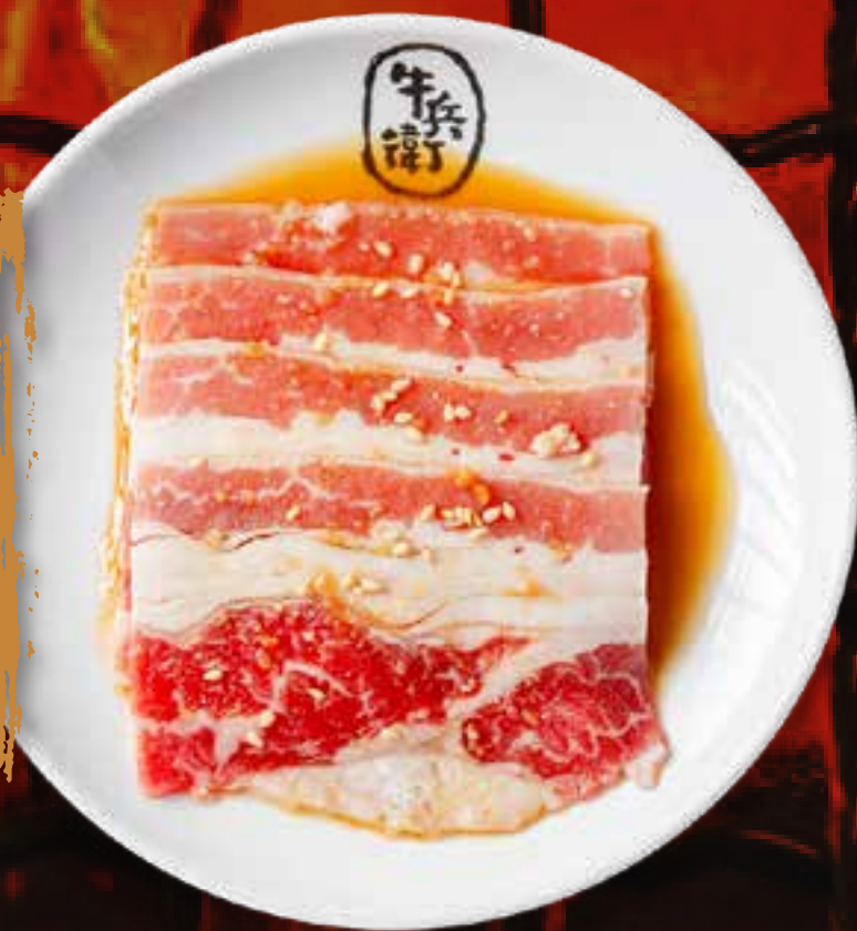
SWEET SOY BEEF BRISKET