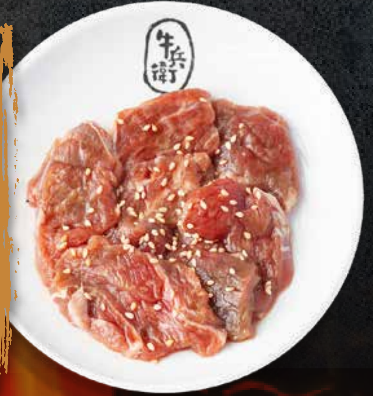
SWEET SOY MARINATED SHORT RIB