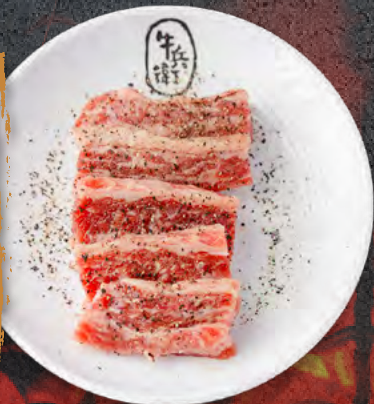
BLACK PEPPER KALBI