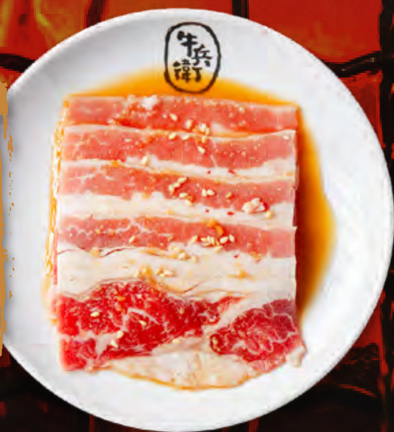
SWEET SOY BEEF BRISKET