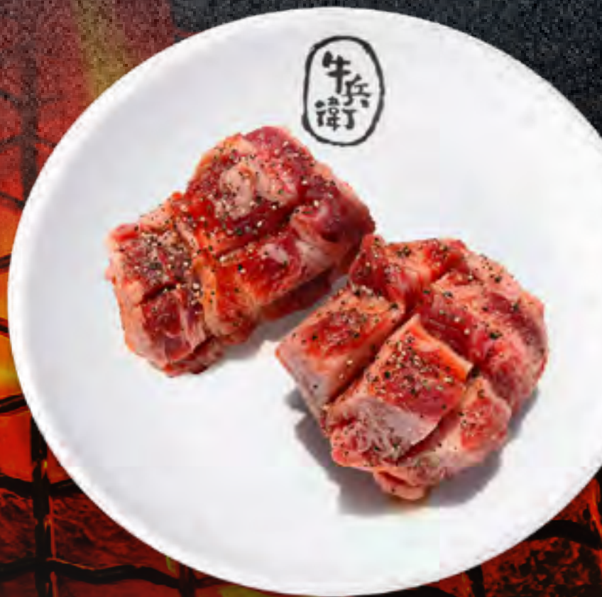
MISO MARINATED STEAK .....