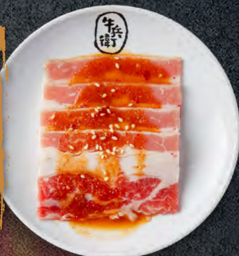
MISO BEEF BRISKET