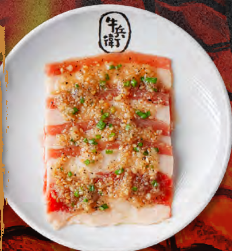
GARLIC BEEF BRISKET