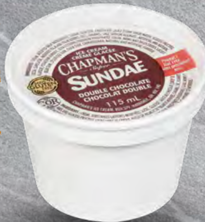
ICE CREAM CUP (Limit 1 per person)