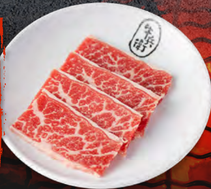
PRIME KALBI .....