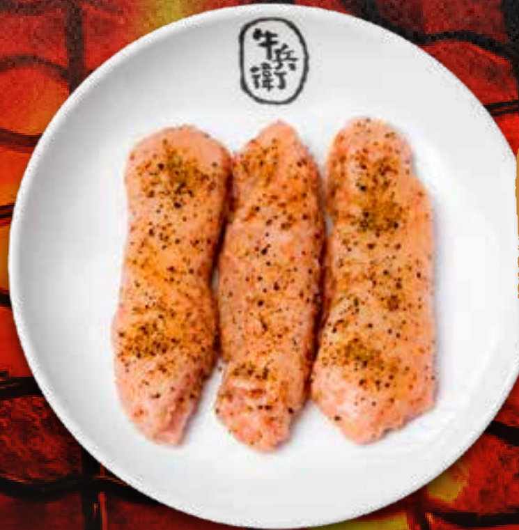
CHICKEN WING .....