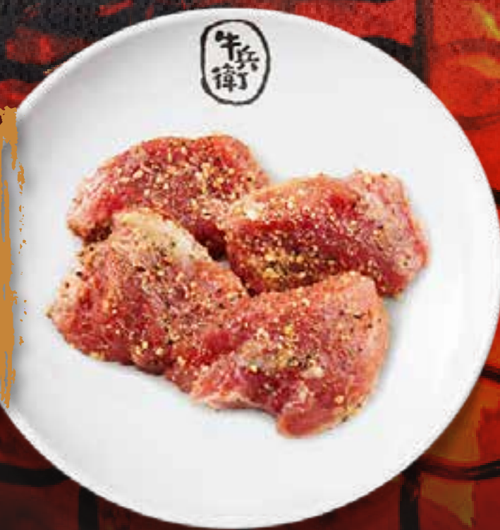
CHICKEN THIGH .....