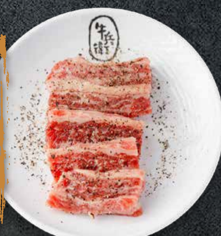
BLACK PEPPER KALBI