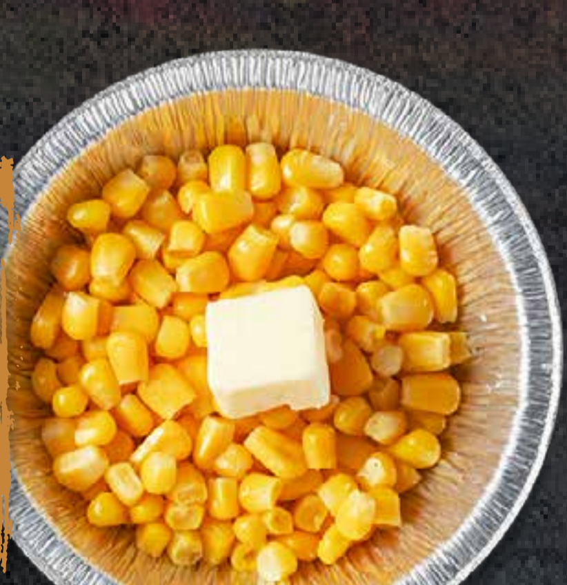
BUTTER CORN (IN FOIL)