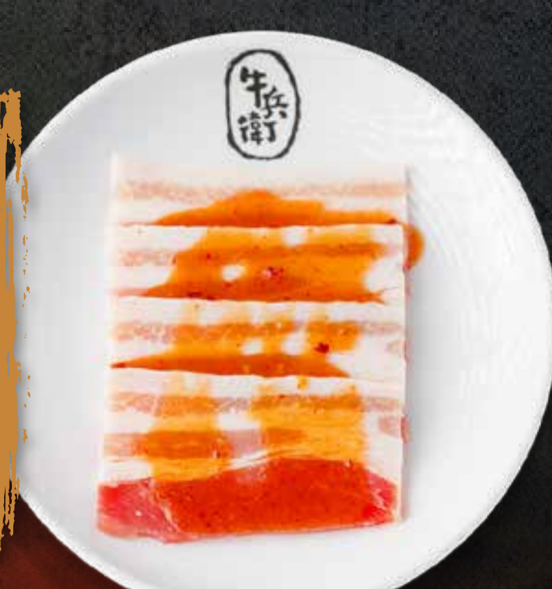
MISO PORK BELLY