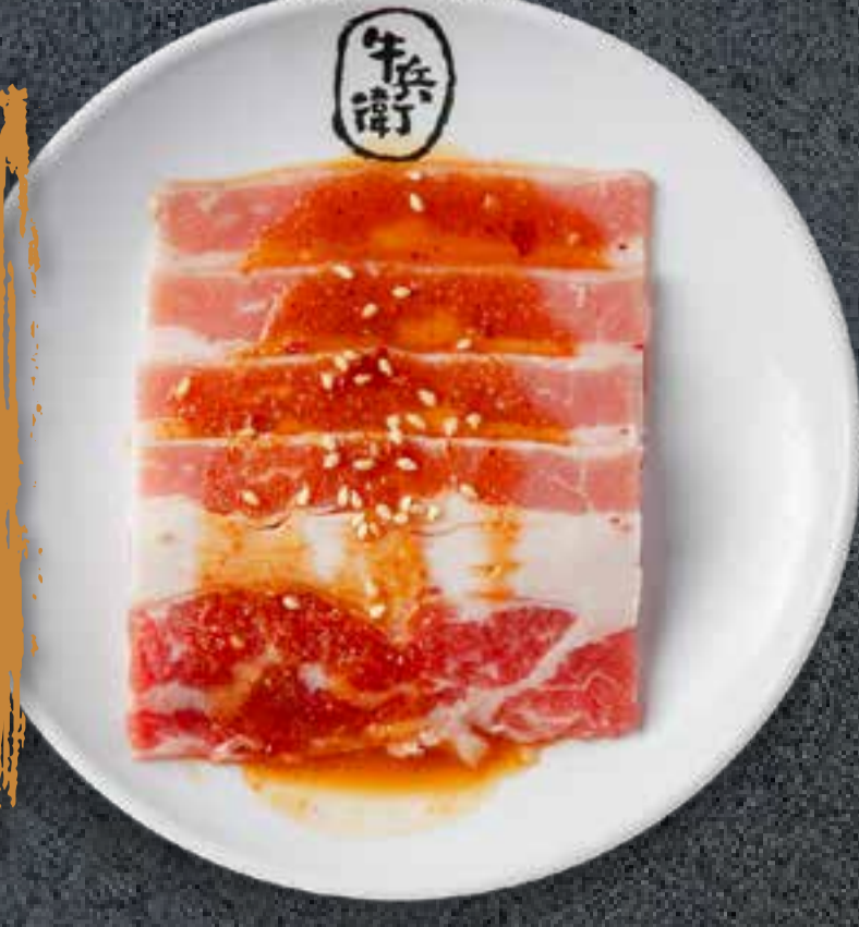
MISO BEEF BRISKET