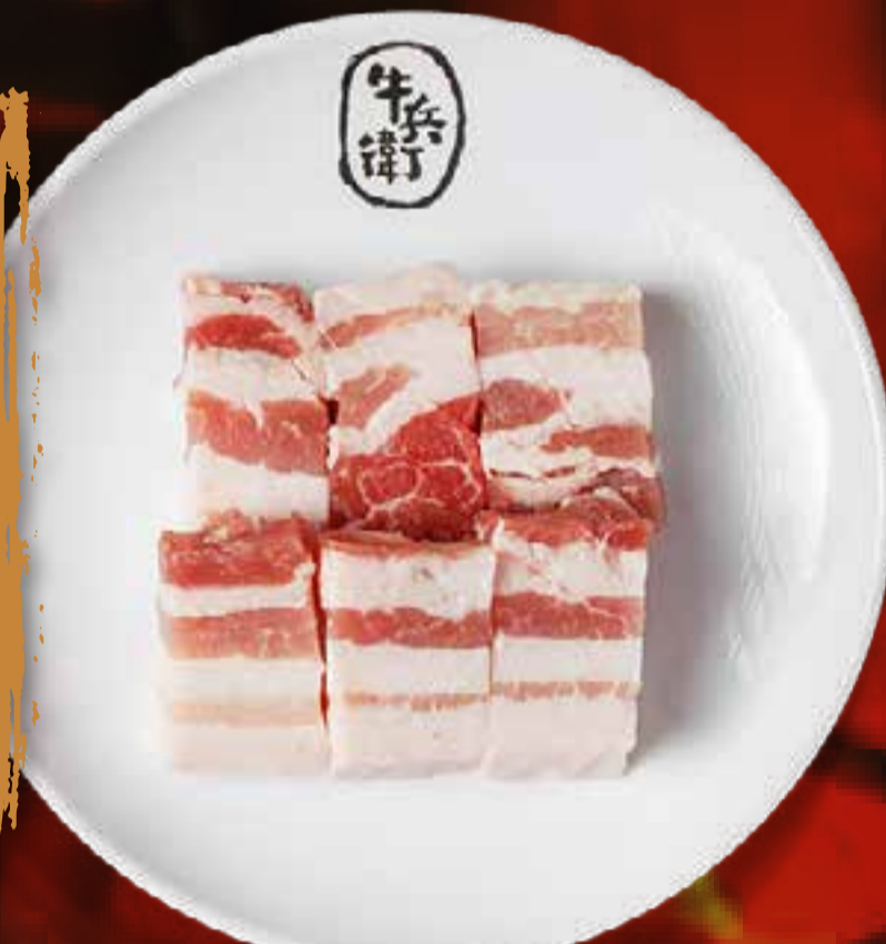
PORK BELLY (THICK CUT)