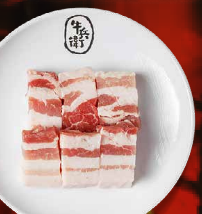
PORK BELLY (THICK CUT)