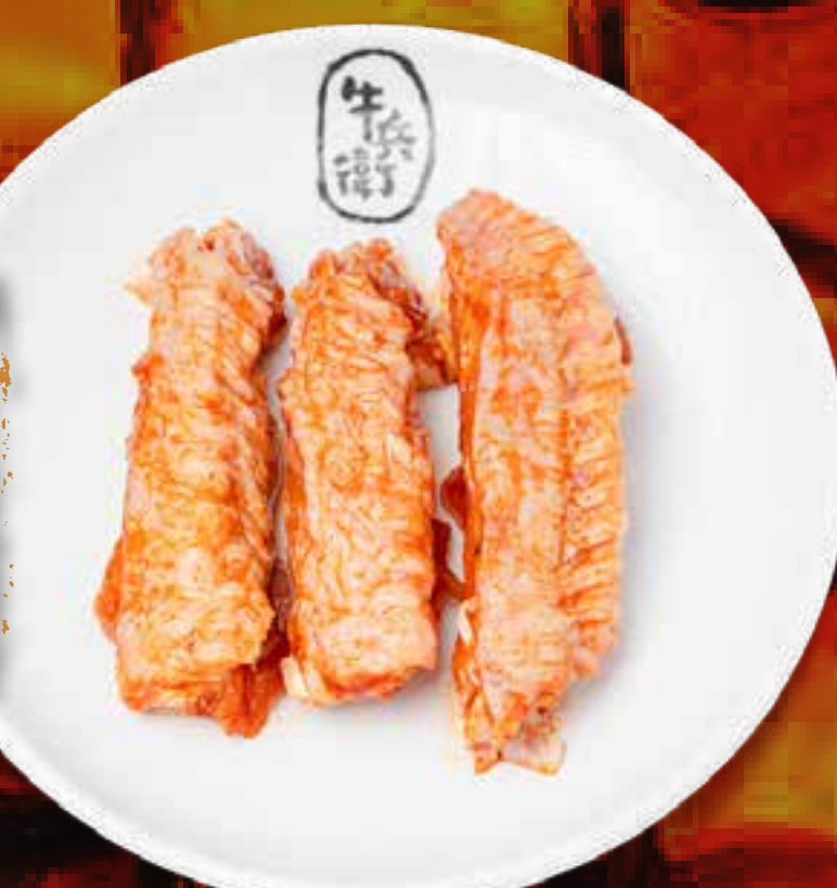
New CHICKEN WING