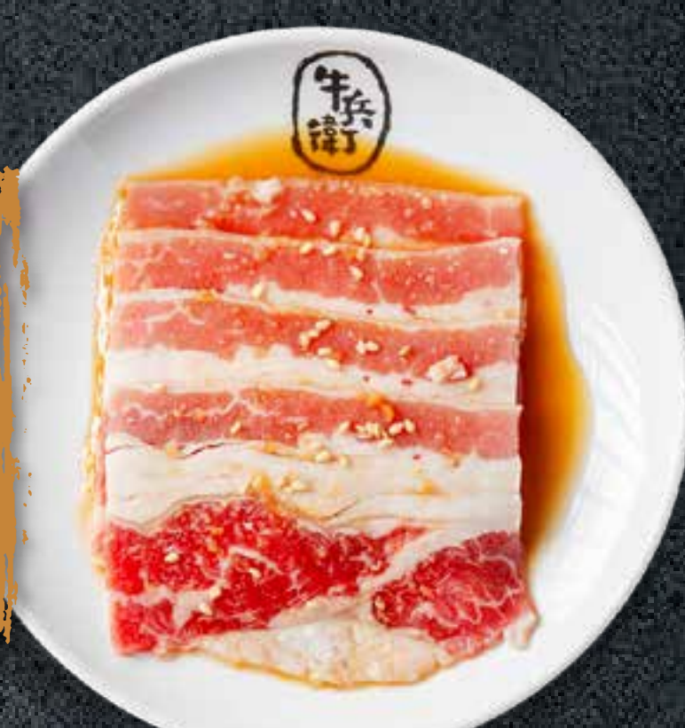
SWEET SOY BEEF BRISKET