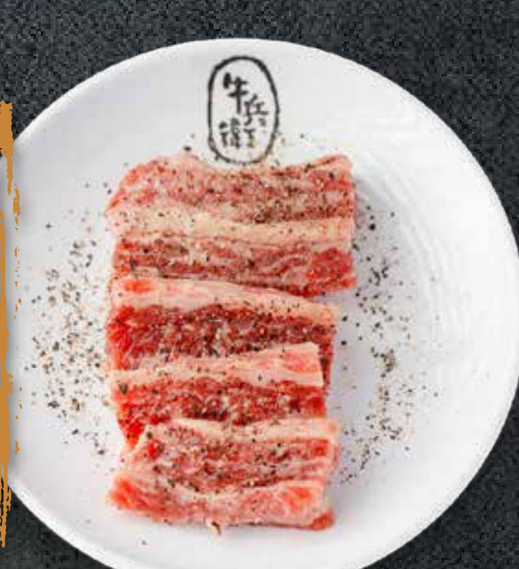
BLACK PEPPER KALBI