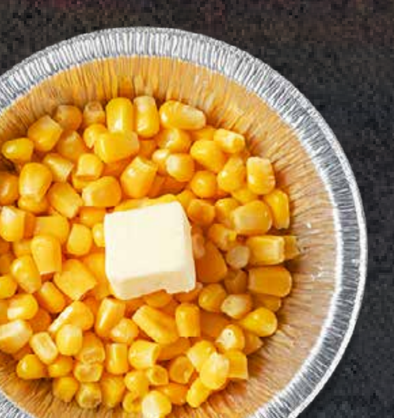
BUTTER CORN (IN FOIL)