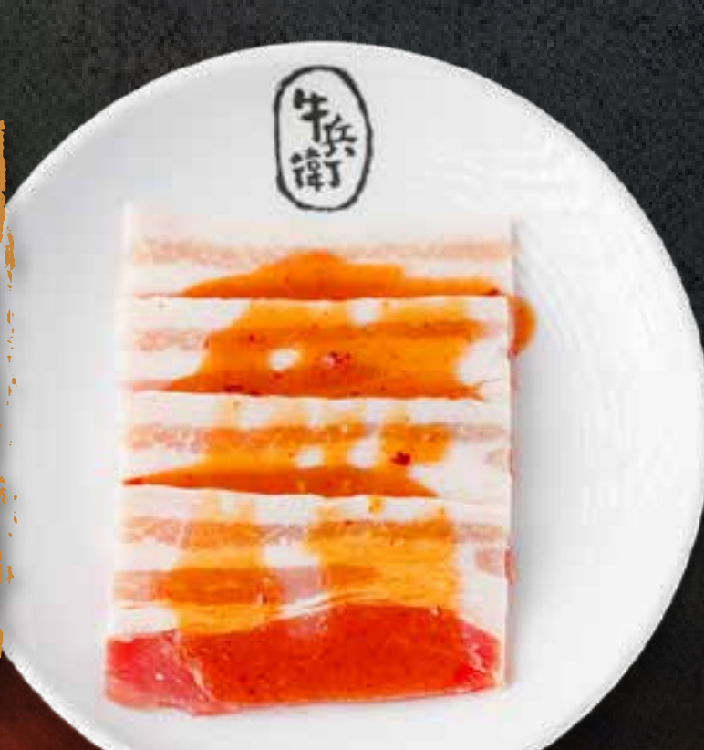
MISO PORK BELLY