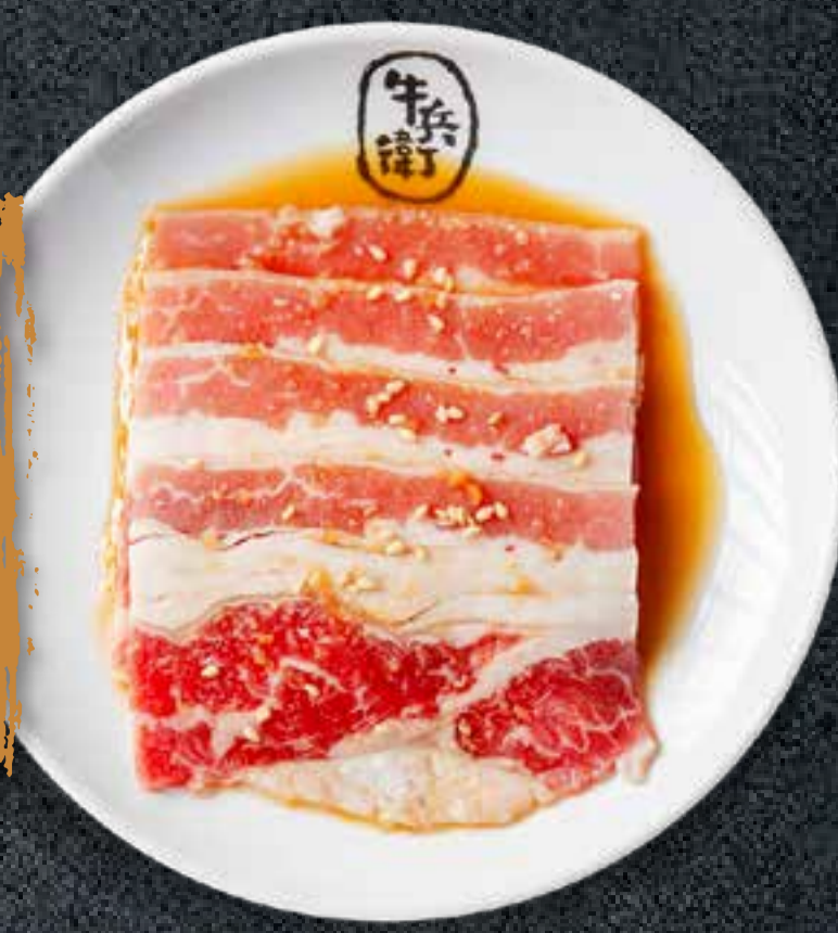
SWEET SOY BEEF BRISKET