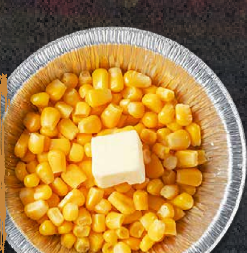
BUTTER CORN (IN FOIL)