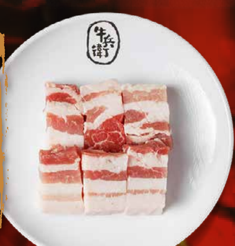
PORK BELLY (THICK CUT)