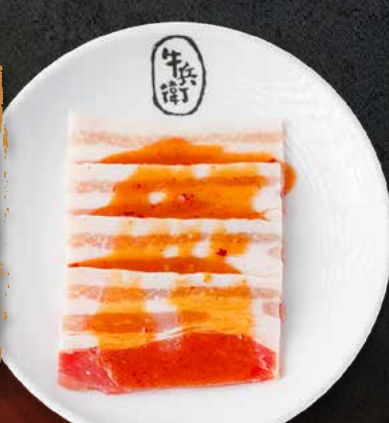
MISO PORK BELLY