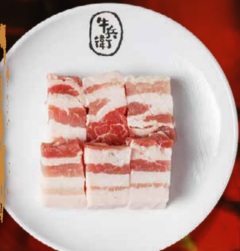
PORK BELLY (THICK CUT)