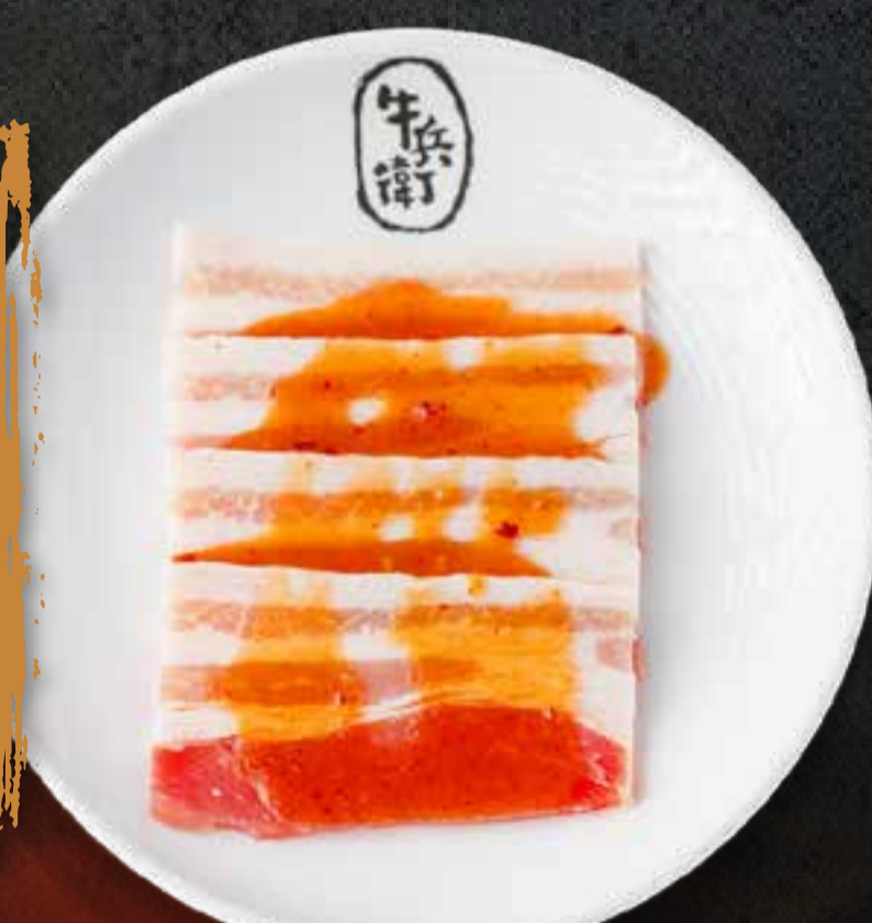
MISO PORK BELLY