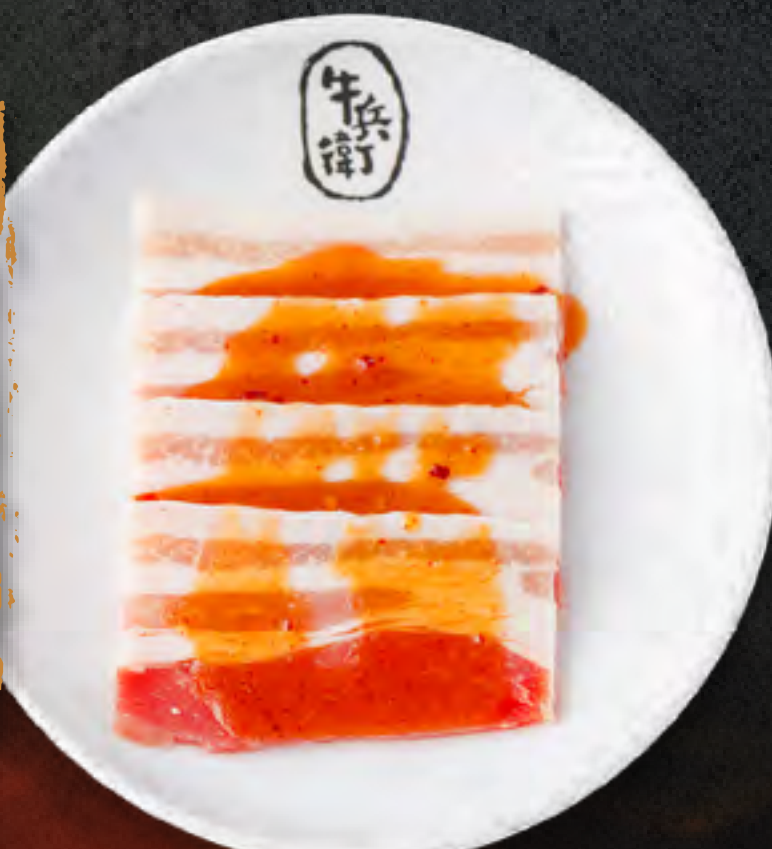
MISO PORK BELLY