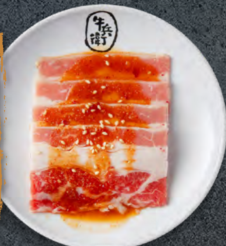
MISO BEEF BRISKET