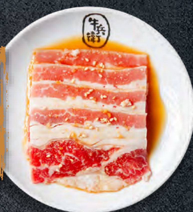
SWEET SOY BEEF BRISKET