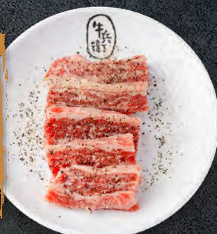
BLACK PEPPER KALBI