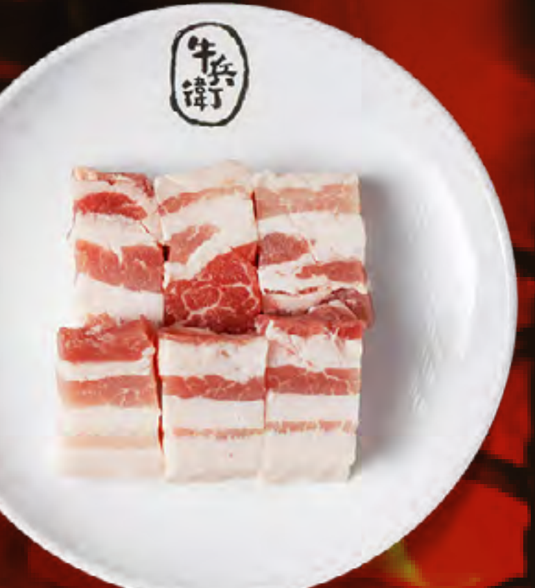
PORK BELLY (THICK CUT)