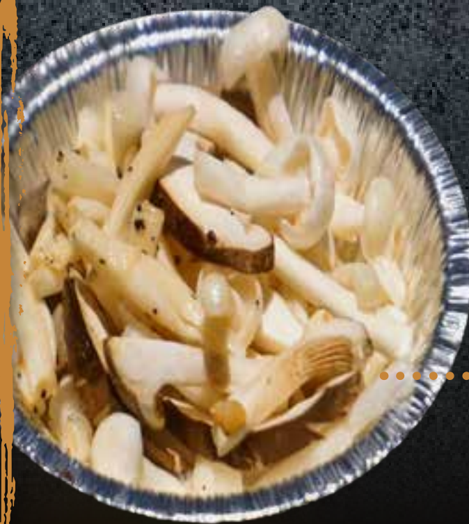
New MUSHROOM MEDLEY (IN FOIL)