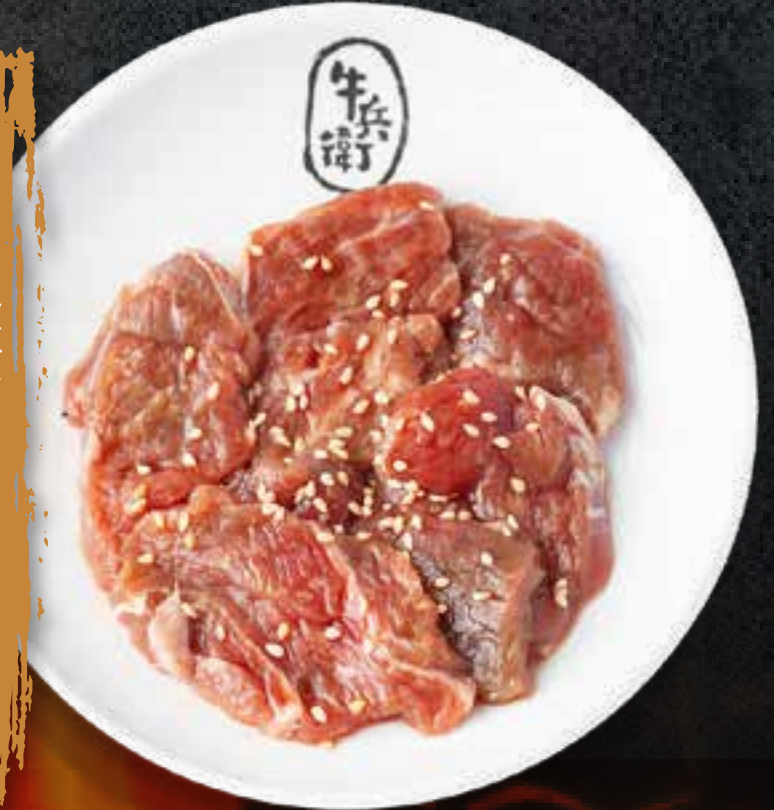
SWEET SOY MARINATED SHORT RIB