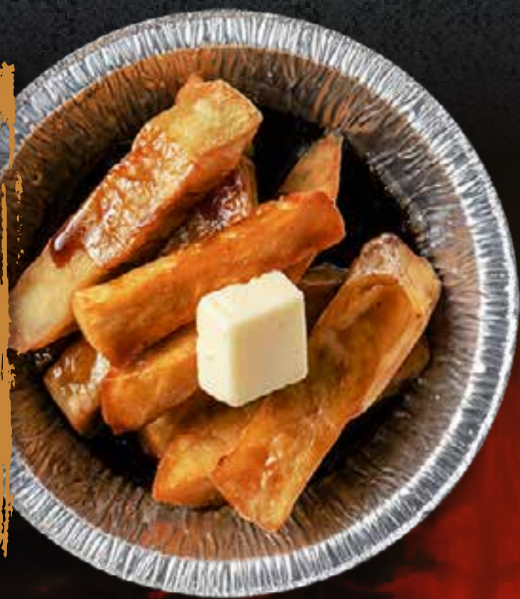
HONEY SWEET POTATO (IN FOIL)