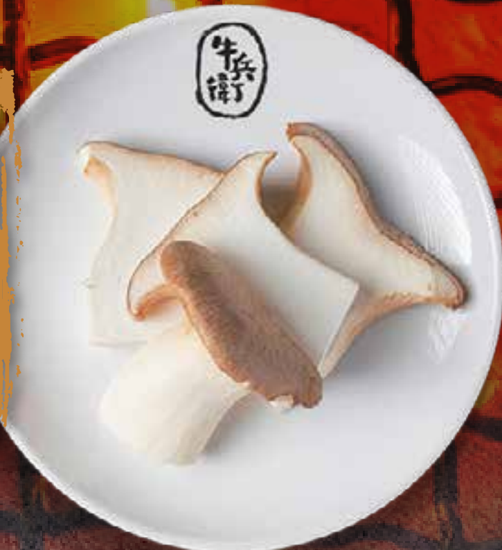
KING OYSTER MUSHROOM