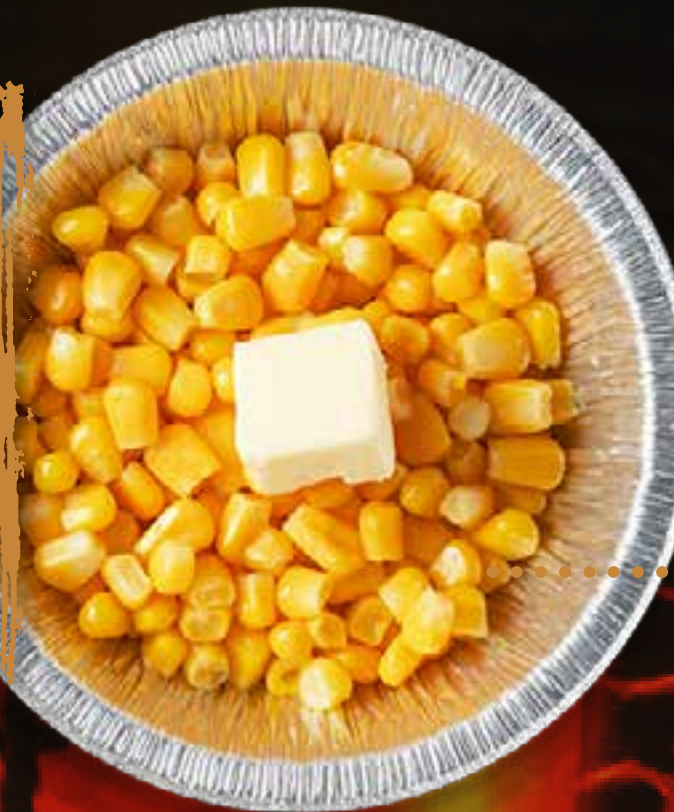
BUTTER CORN (IN FOIL)