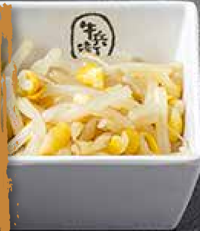
UMAMI BEAN SPROUT