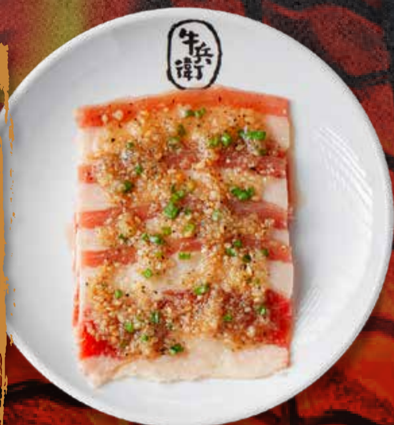
GARLIC BEEF BRISKET