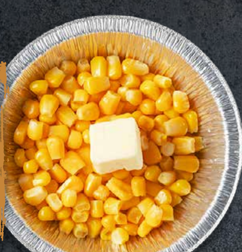
MAÏS AU BEURRE (EN PAPILOTTE)