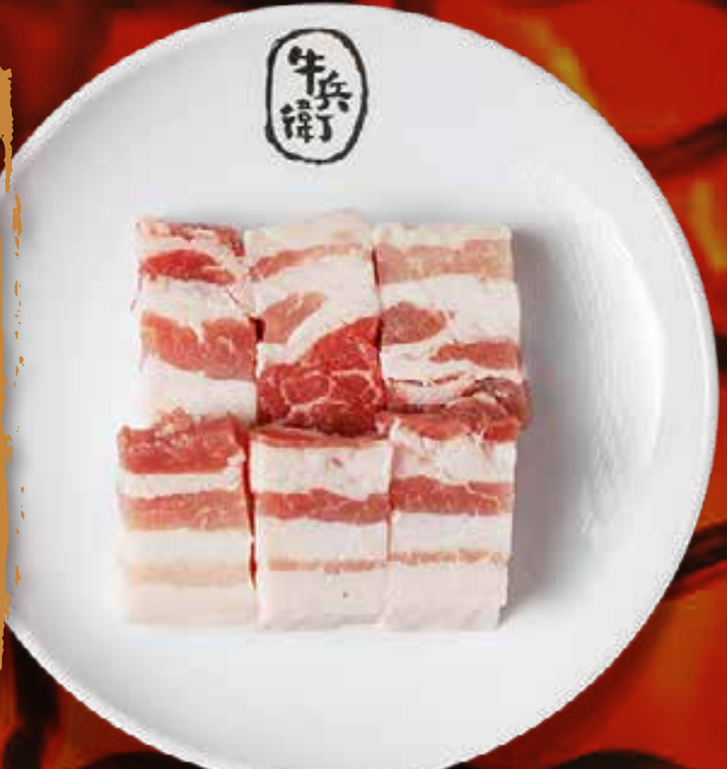
POITRINE DE PORC (COUPE ÉPAISSE)