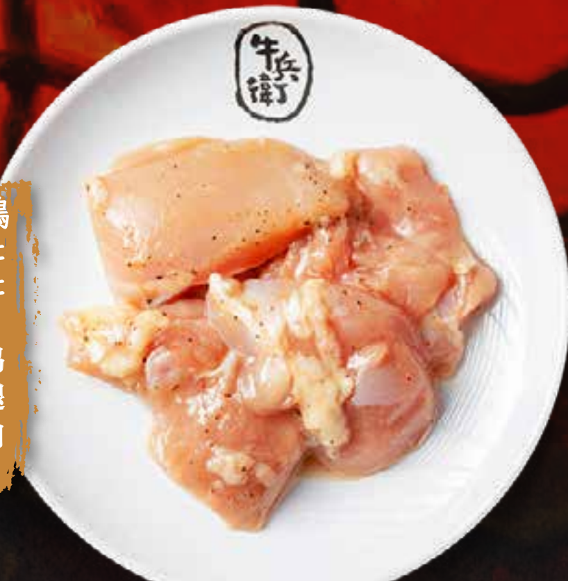
CUISSE DE POULET