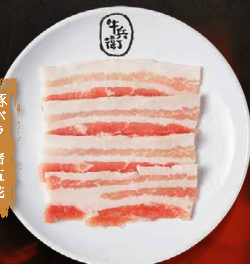
POITRINE DE PORC