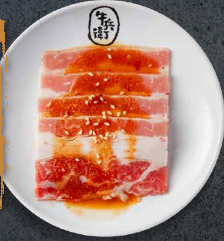
BRISKET DE BŒUF AU MISO