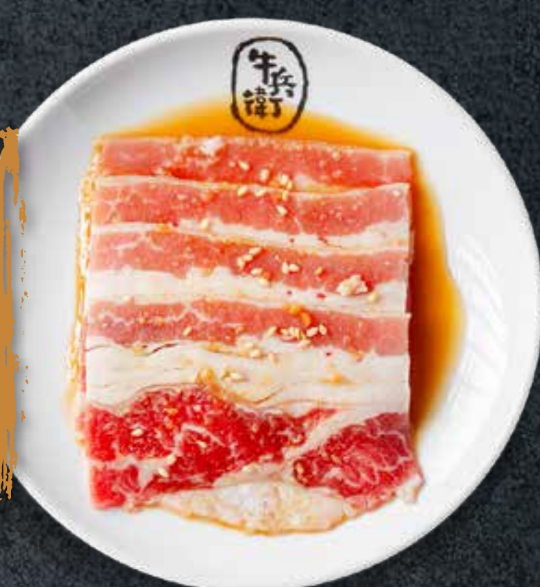
POITRINE DE BŒUF MARINÉE AU SOJA DOUX