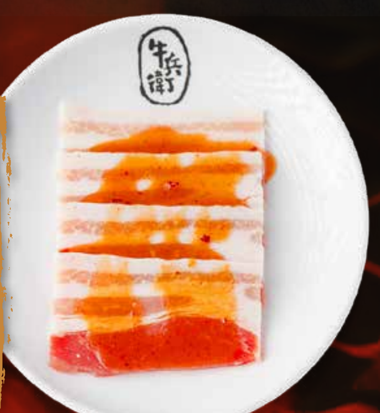
POITRINE DE PORC AU MISO