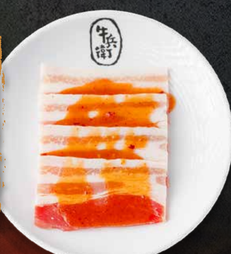
MISO PORK BELLY