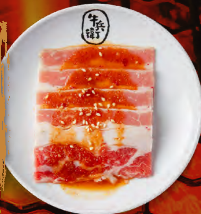
MISO BEEF BRISKET