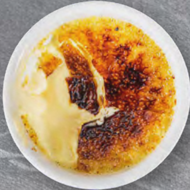
CRÈME BRÛLÉE .....