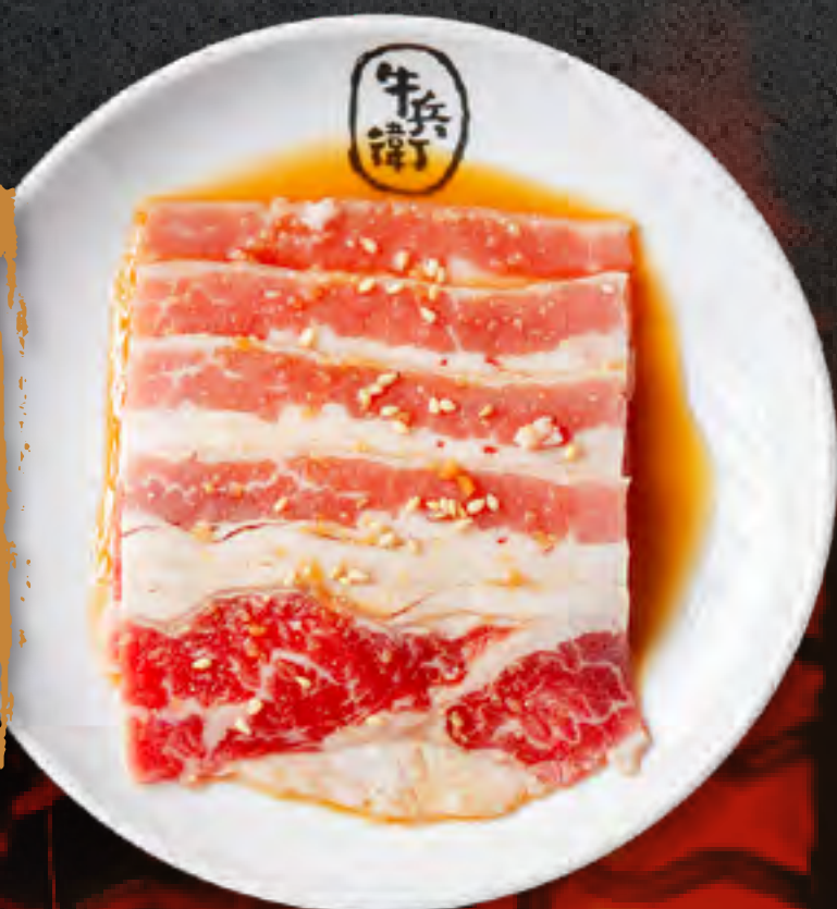
SWEET SOY BEEF BRISKET