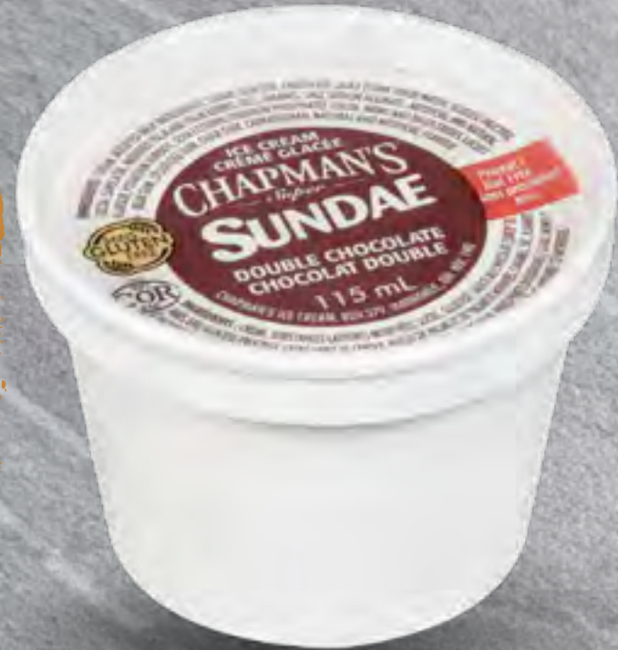
ICE CREAM CUP