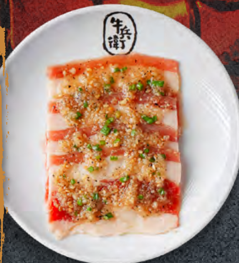
GARLIC BEEF BRISKET