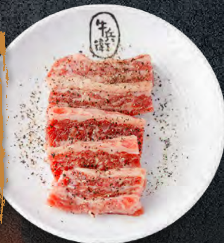
BLACK PEPPER KALBI