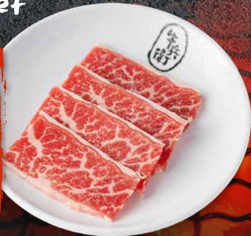
PRIME KALBI .....