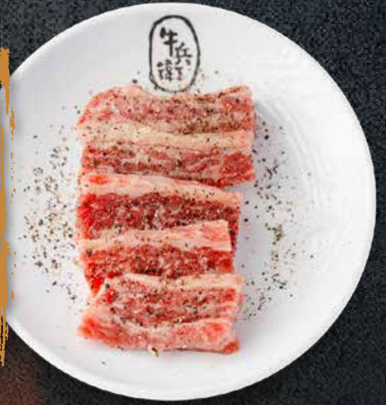
BLACK PEPPER KALBI