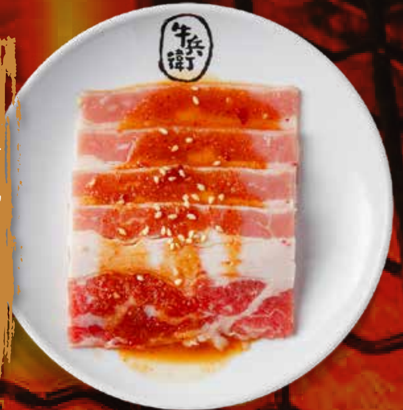
MISO BEEF BRISKET