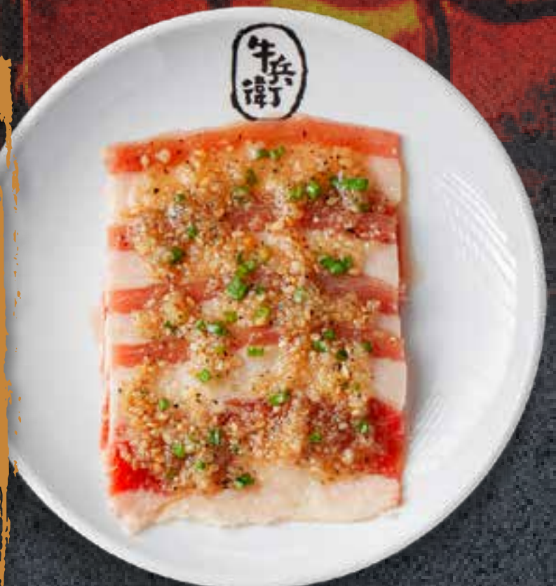
GARLIC BEEF BRISKET