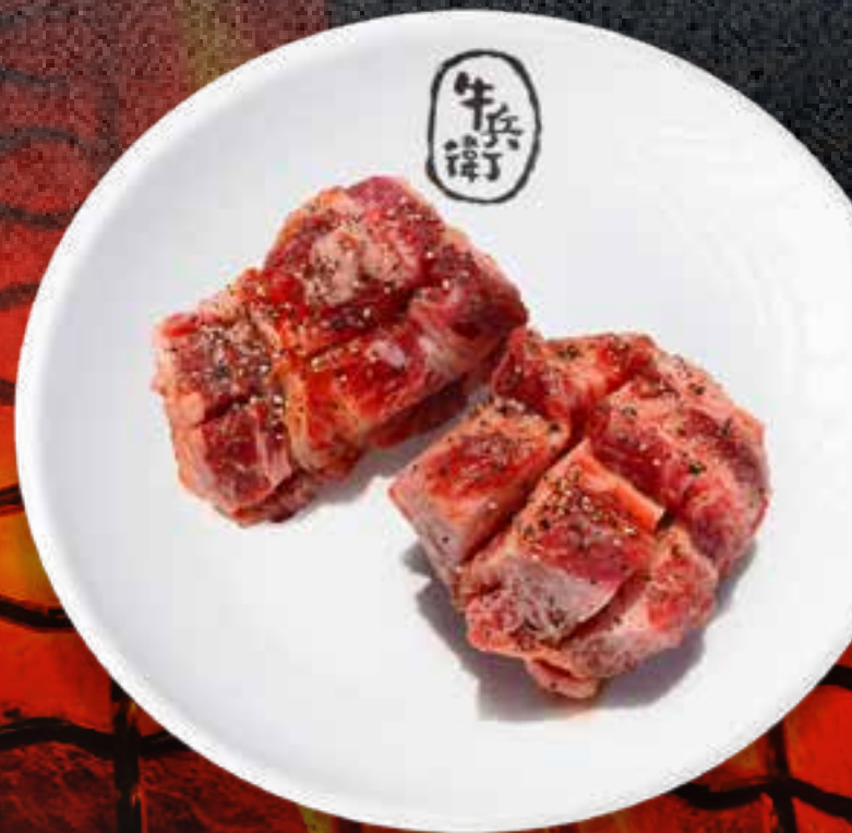
MISO MARINATED STEAK .....