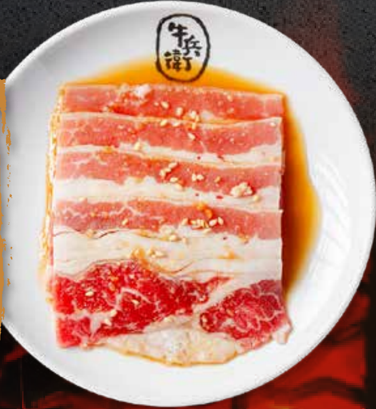
SWEET SOY BEEF BRISKET