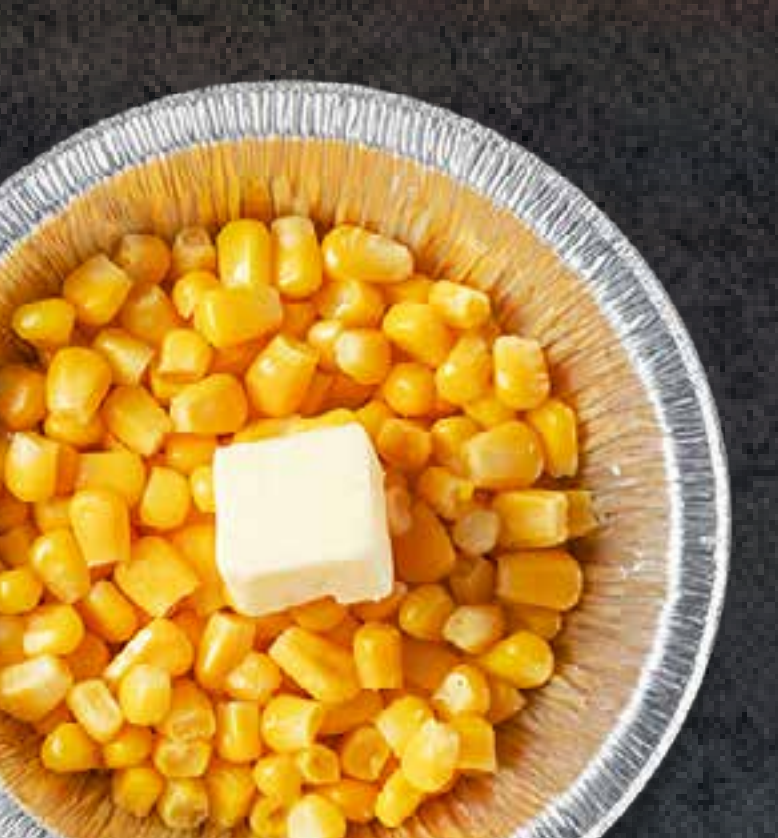
BUTTER CORN (IN FOIL)