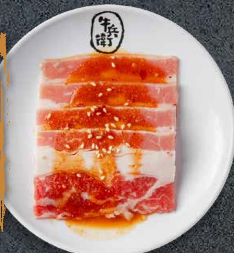
MISO BEEF BRISKET