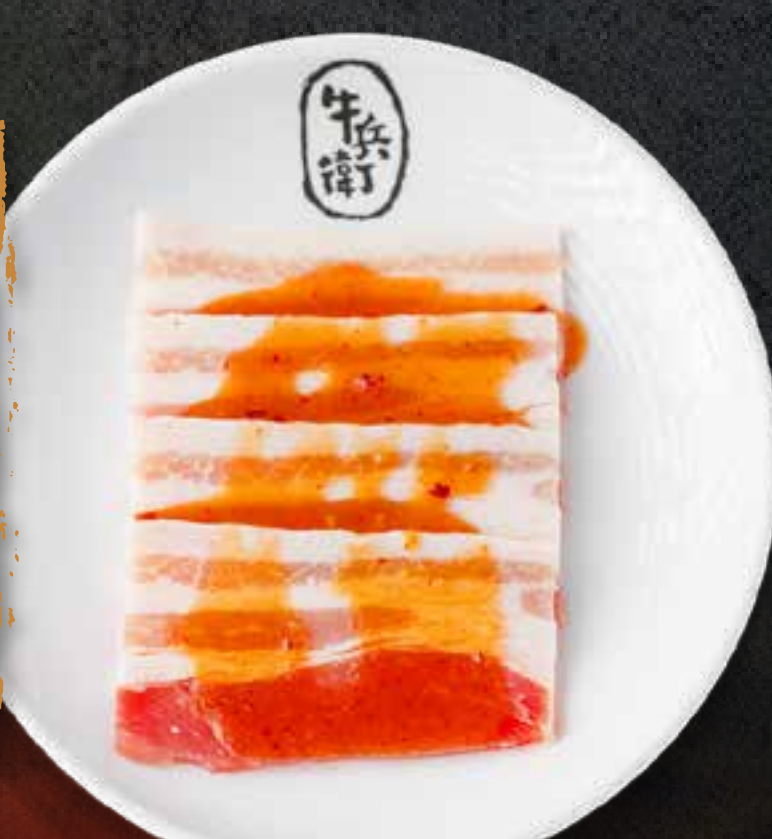
MISO PORK BELLY