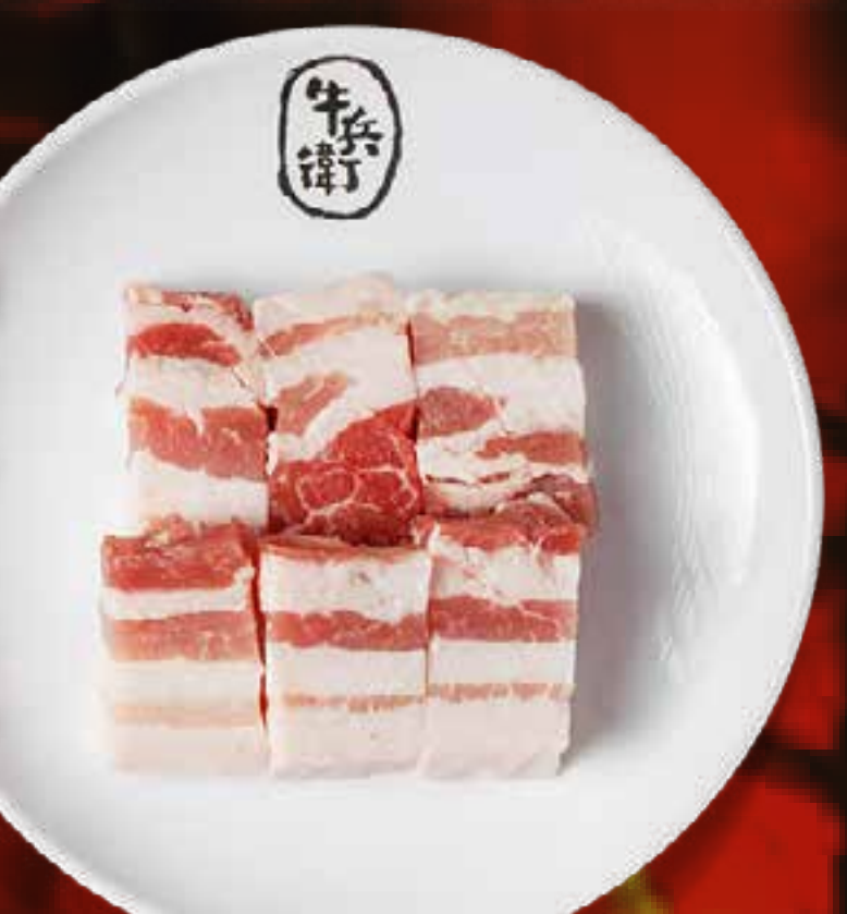
PORK BELLY (THICK CUT)