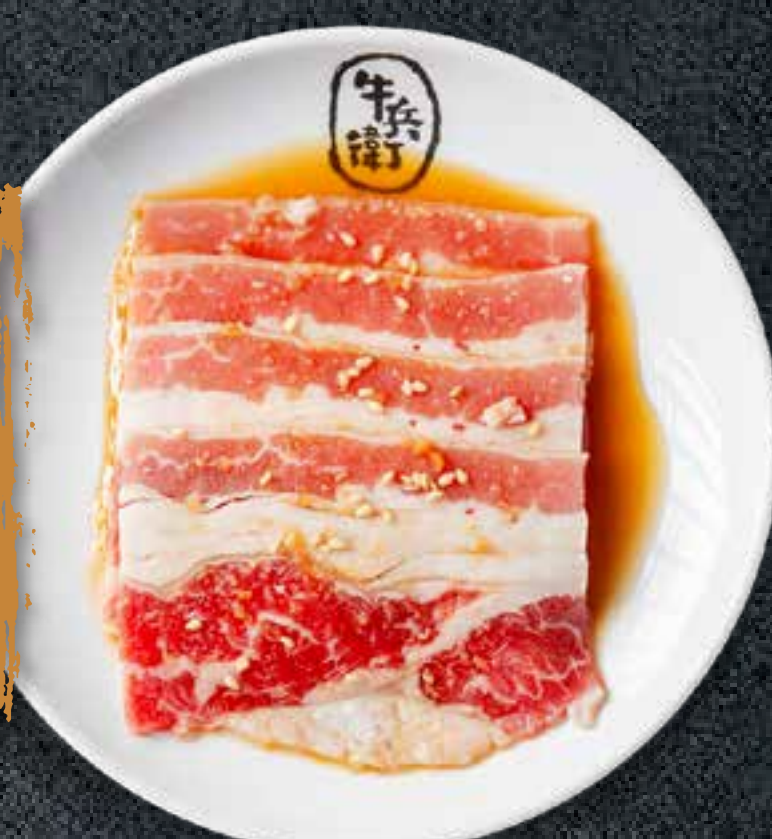
SWEET SOY BEEF BRISKET