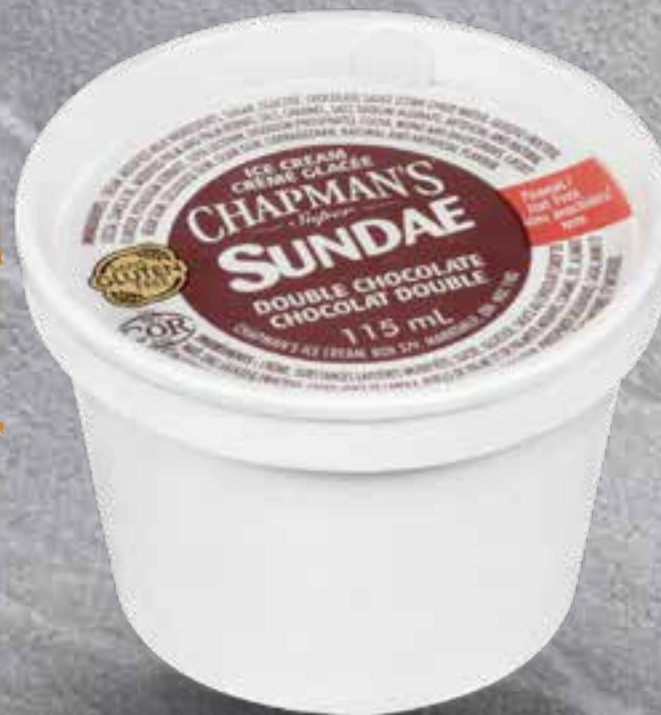
ICE CREAM CUP