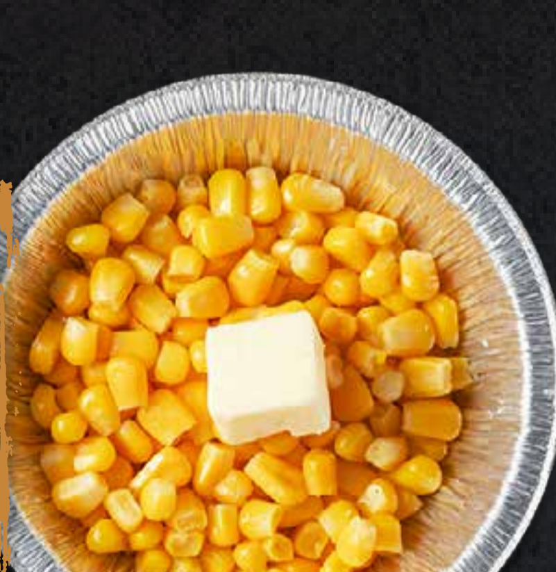
BUTTER CORN (IN FOIL)