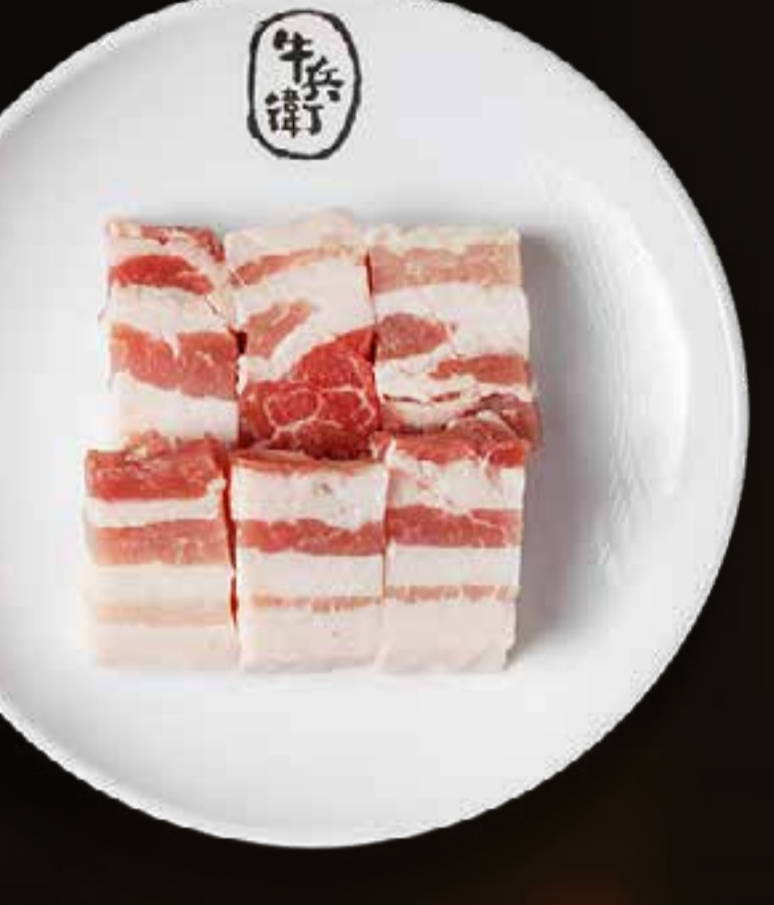
PORK BELLY (THICK CUT)