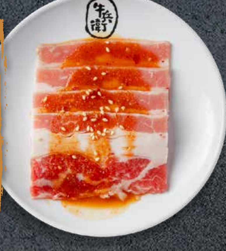
MISO BEEF BRISKET