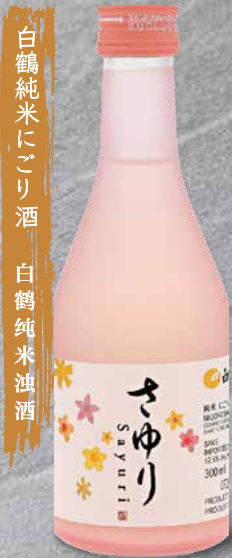
白鶴純米にがり酒 白鶴純米油酒