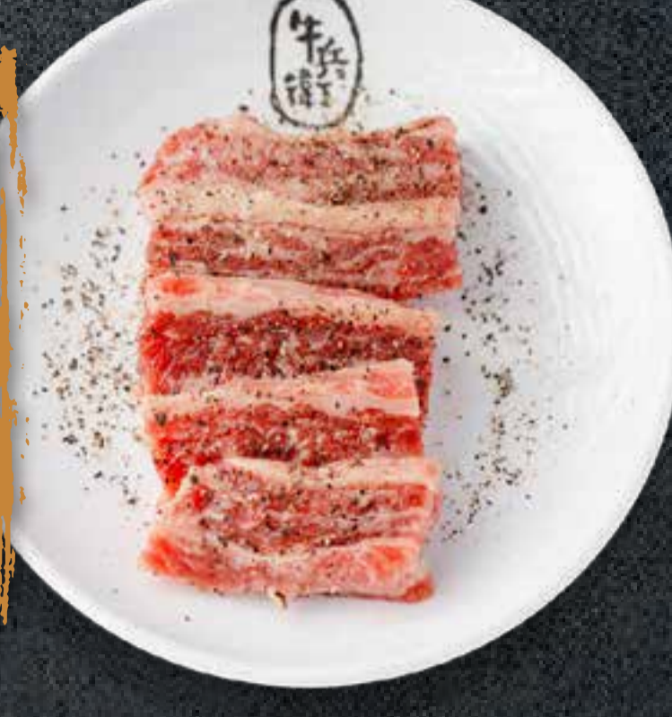
BLACK PEPPER KALBI