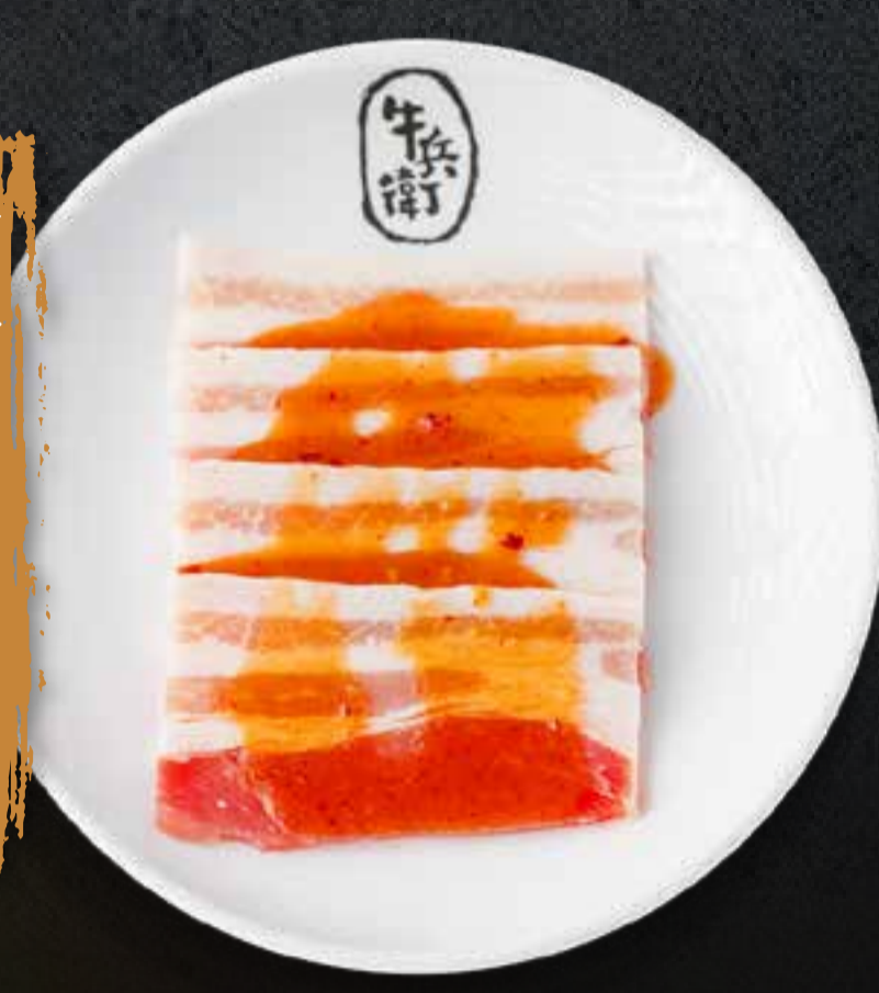
MISO PORK BELLY