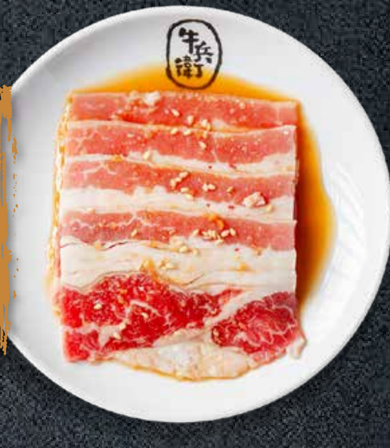
SWEET SOY BEEF BRISKET