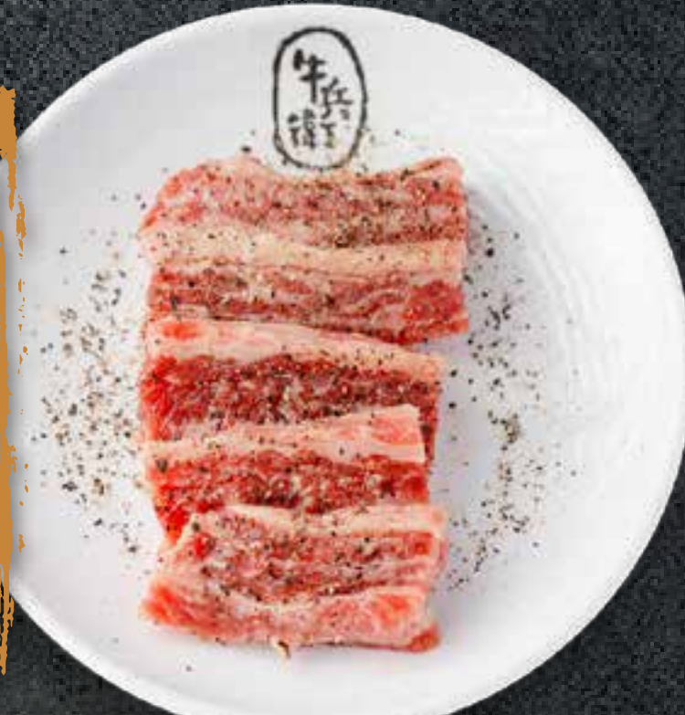
BLACK PEPPER KALBI