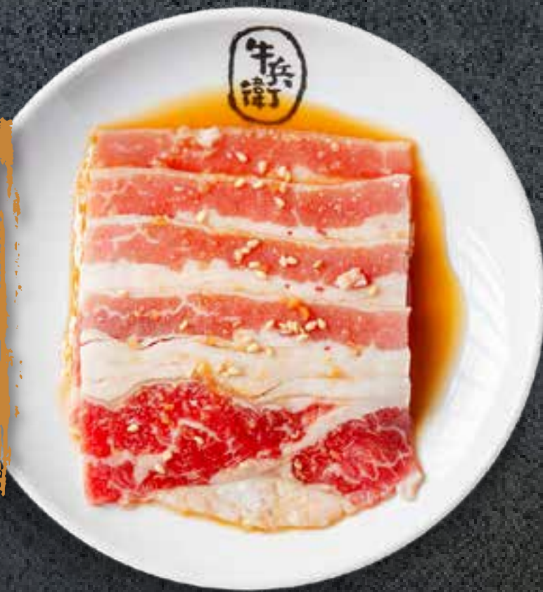
SWEET SOY BEEF BRISKET