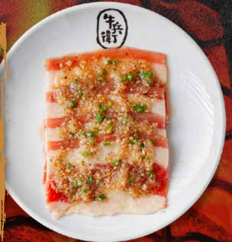
GARLIC BEEF BRISKET