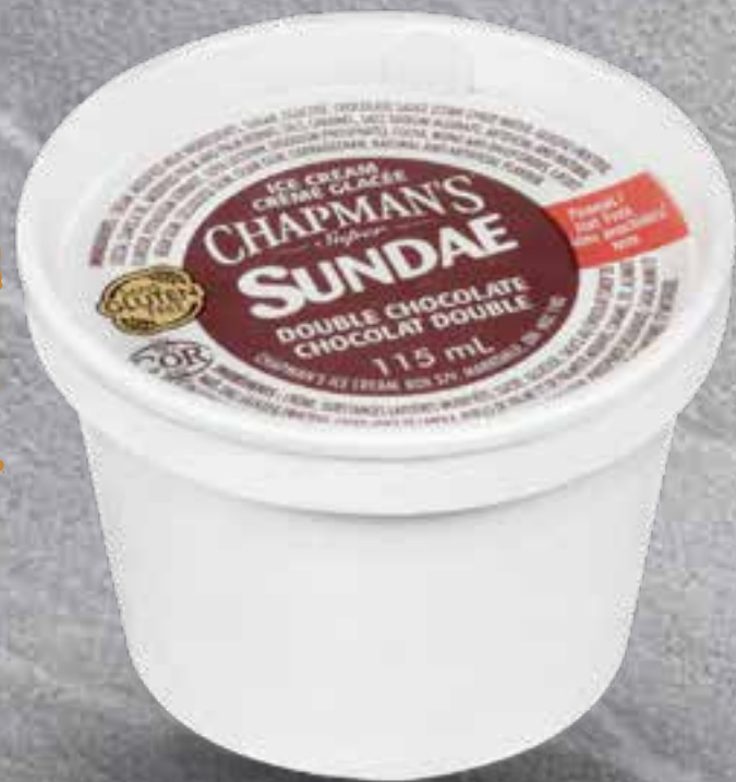
ICE CREAM CUP (Limit 1 per person)