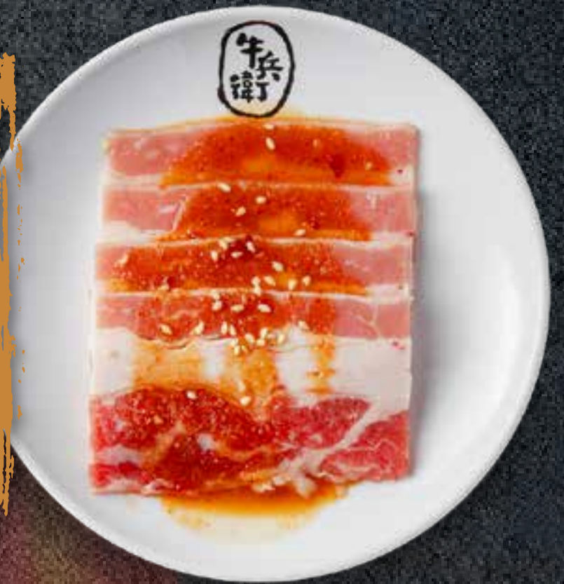
MISO BEEF BRISKET