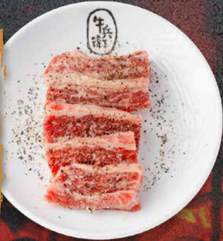
BLACK PEPPER KALBI