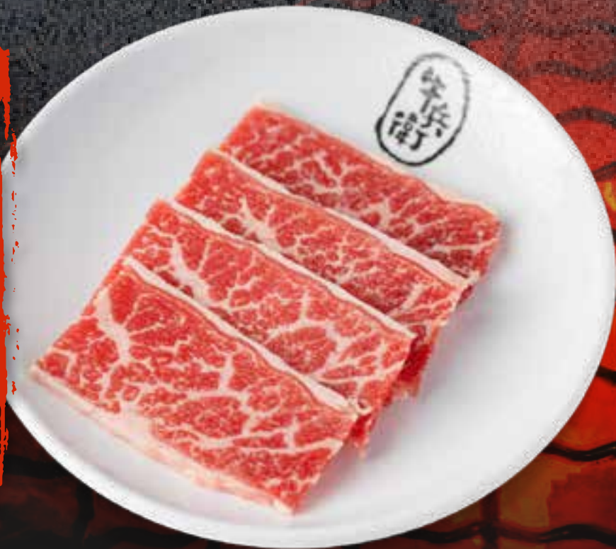
PRIME KALBI .....