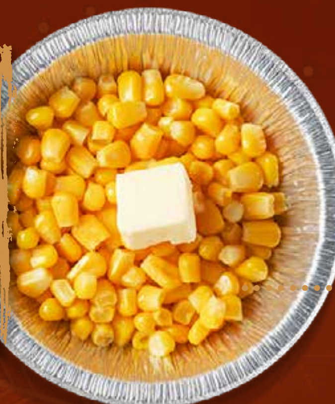
BUTTER CORN (IN FOIL)