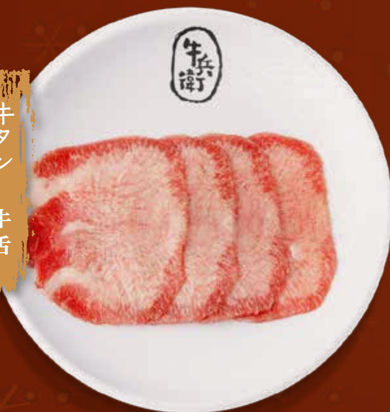
BEEF TONGUE .....