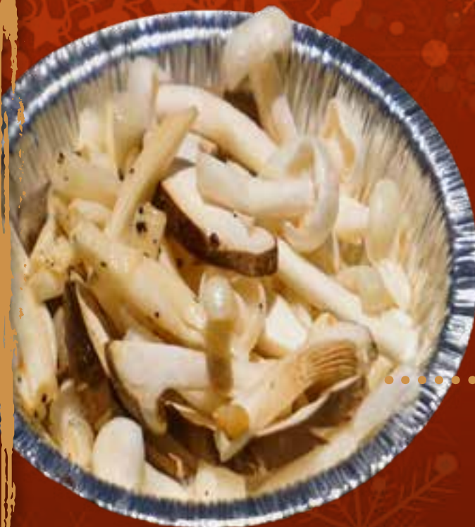
New MUSHROOM MEDLEY (IN FOIL)