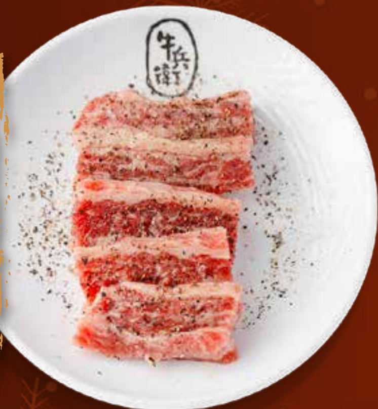
BLACK PEPPER KALBI .....