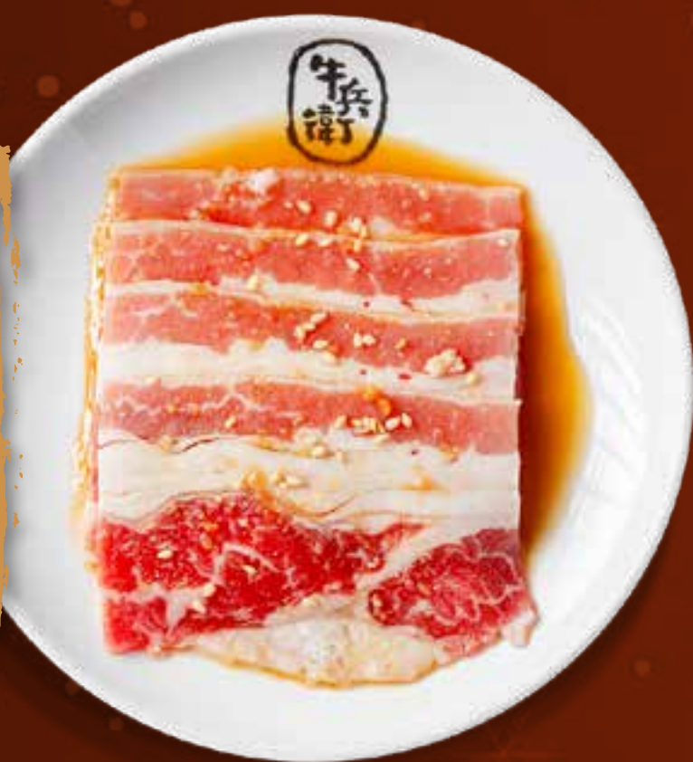
SWEET SOY BEEF BRISKET .....