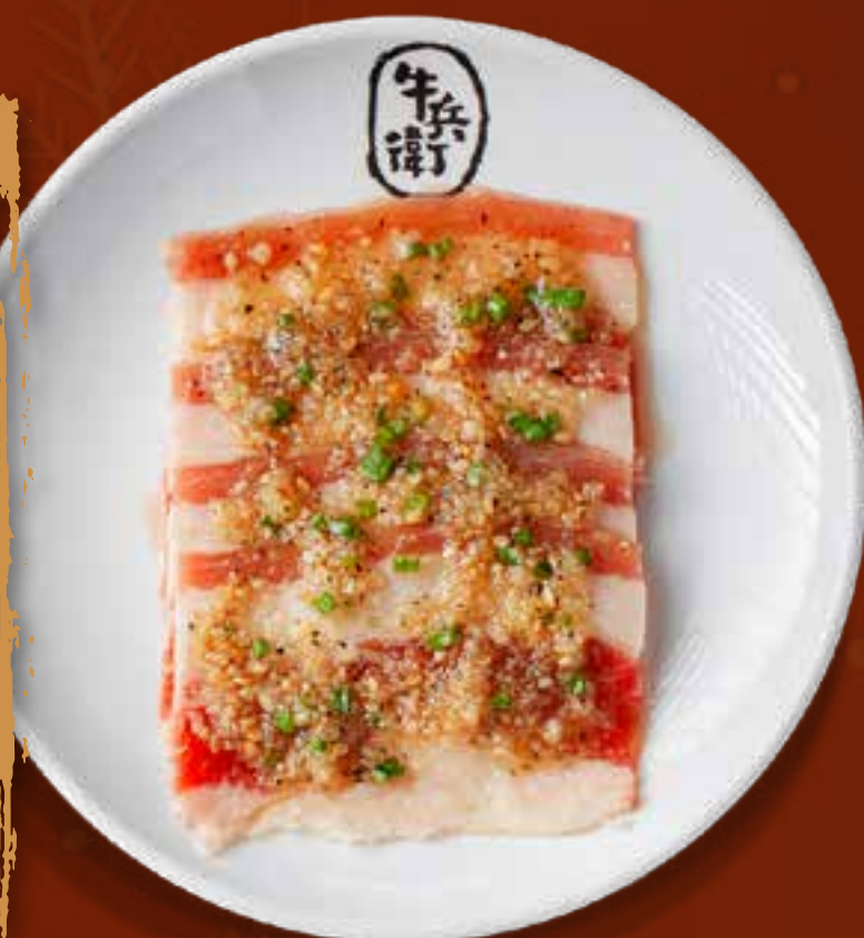
GARLIC BEEF BRISKET .....