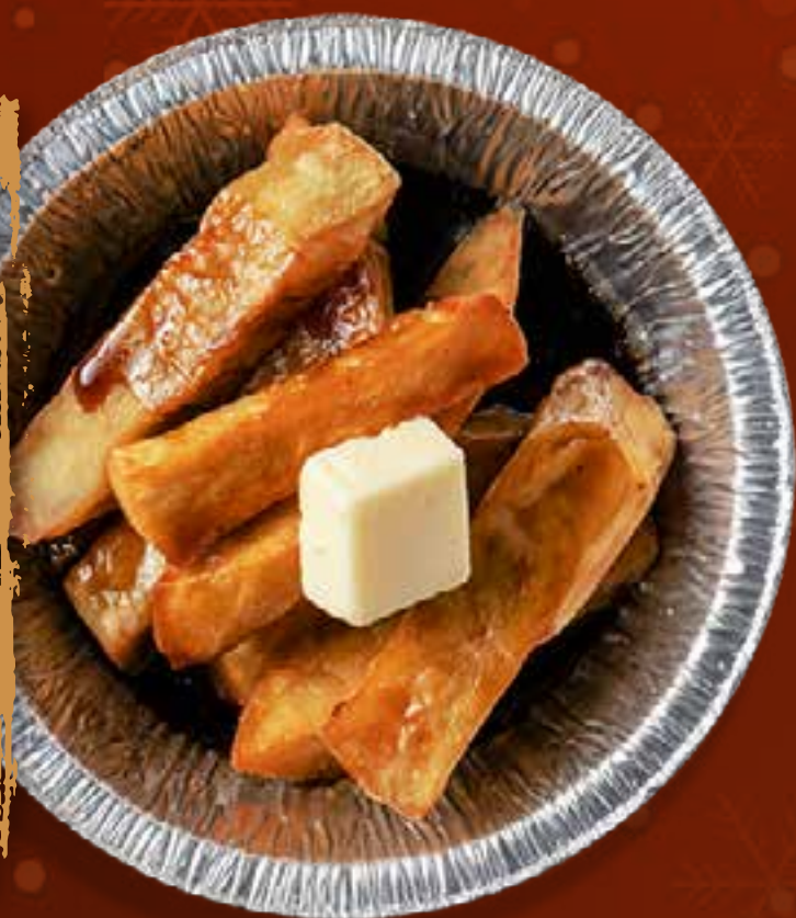
HONEY SWEET POTATO (IN FOIL)