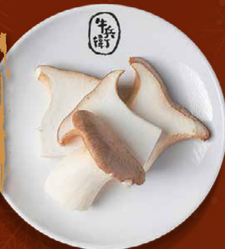
KING OYSTER MUSHROOM