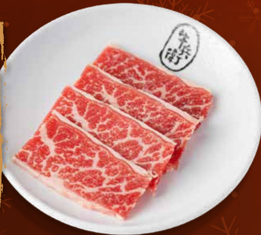
PRIME KALBI .....