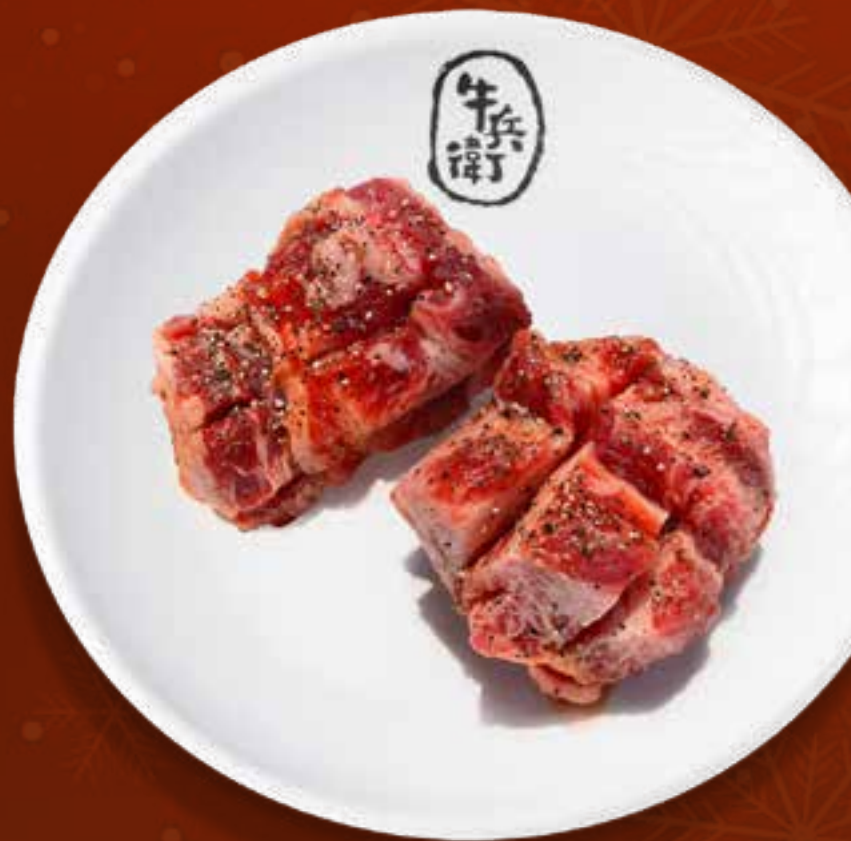
MISO MARINATED STEAK .....