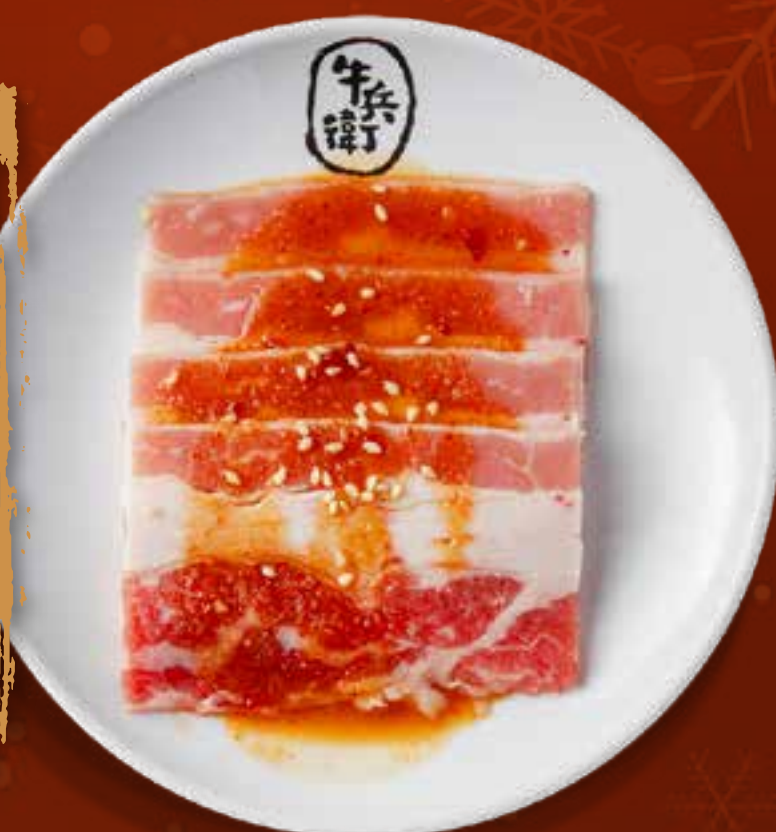
MISO BEEF BRISKET .....