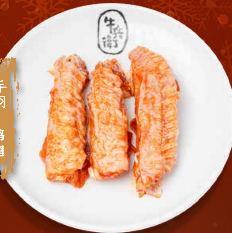
CHICKEN WING .....