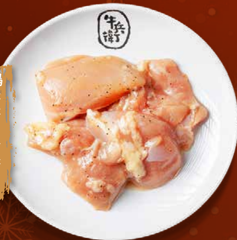
CHICKEN THIGH .....